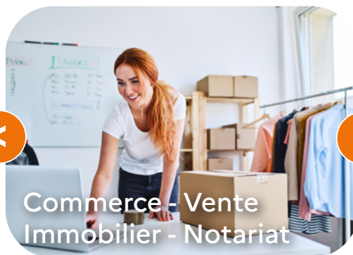
Commerce - Vente Immobilier - Notariat