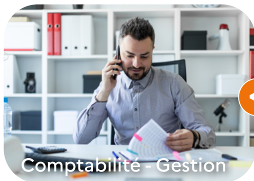
Comptabilité - Gestion