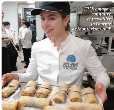
TP "fromage", connaître et travailler la Fourme de Montbrison AOP

Imaginez des cours de rêves! Les formateurs? Les chefs de cuisine du Restaurant gastronomique le Rabelais ou MOF en sommellerie. Les intervenants? Spécialiste des champignons, un autre de la volaille de Bresse ou de la Fourme d'Ambert... Cours magistraux, échanges... puis on file en cuisine pour tester tout cela. Tests de gammes de volailles, de cuisson, d'accompagnement, recettes de terroir, audaces... comme ce dessert étonnant de bananes et morilles! Cette formation est destinée à former des managers chargés d'encadrer et d'animer des actions de développement local et de mise en tourisme des productions alimentaires et gastronomiques. Elle forme, entre autre, à l'expertise des produits de qualité dans la cuisine gastronomique locale, les épicerie fines et l'organisation d'actions de valorisation des productions et d'animations touristiques.