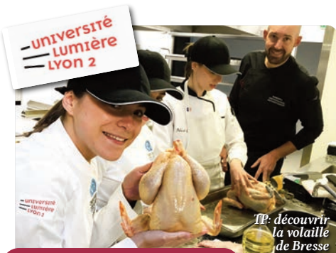
TP: découvrir la volaille de Bresse