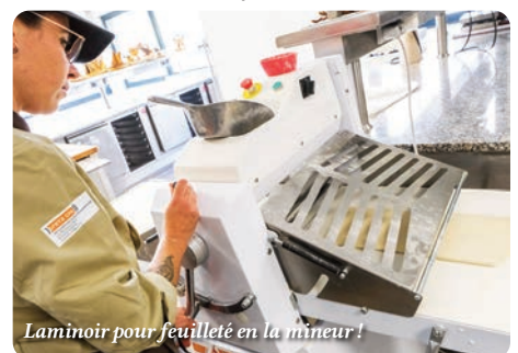
Laminoir pour feuilleté en la mineur!