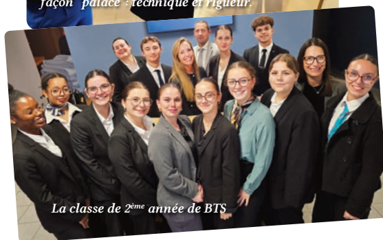
La classe de 2 ème année de BTS