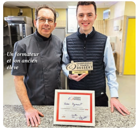
Un formateur et son ancien élève

tis, afin de leur offrir une expérience professionnelle et humaine enrichissante. Ces mobilités permettent aux jeunes de découvrir d'autres pratiques professionnelles, d'autres organisations de travail et des savoir-faire propres à différents pays. Elles contribuent ainsi à élargir leur regard sur les métiers et à renforcer leur capacité d'adaptation, des compétences particulièrement recherchées dans les secteurs de l'hôtellerie et de la restauration. A une époque où les soft skills sont importants, les séjours à l'étranger sont une expérience personnelle marquante. Les apprentis gagnent en autonomie, développent leur confiance en eux et s'adaptent à un environnement nouveau. Pour les entreprises, ces expériences représentent également une valeur ajoutée. Les jeunes qui ont bénéficié d'une mobilité internationale reviennent souvent plus ouverts, plus autonomes. Dans notre prochain numéro, zoom sur nos expériences avec Budapest et Milan. Nos partenaires allemands de HOGA, à la soirée du 5/02/26