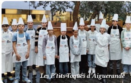
Les P'tits Toqués d'Aiguerande