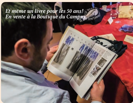
Et même un livre pour les 50 ans! En vente à la Boutique du Campus