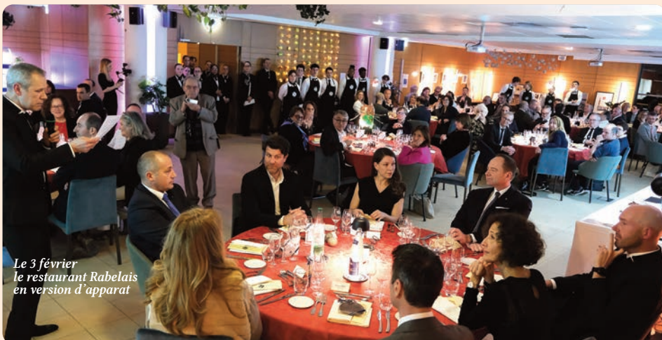
Le 3 février le restaurant Rabelais en version d'apparat

Mardi 3 février 18h29, derniers détails pour les serveurs : accorder le ruban du nœud-papillon avec la sangle du tablier. les 84 invités arrivent dans une demie-heure. Tout est prêt.