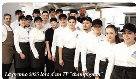
La promo 2025 lors d'un TP "champignon"