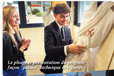
Le pliage et présentation du peignoir façon "palace": technique et rigueur.

*housekeeping: département hôtelier responsable de l'entretien esthétique de l'établissement et de la création d'un environnement plus sûr et accueillant pour les clients.