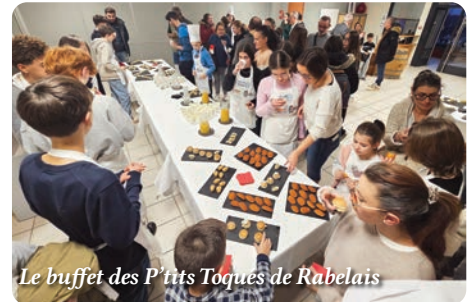
Le buffet des P'tits Toqués de Rabelais