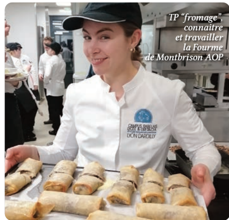
TP "fromage", connaître et travailler la Fourme de Montbrison AOP

Imaginez des cours de rêves! Les formateurs? Les chefs de cuisine du Restaurant gastronomique le Rabelais ou MOF en sommellerie. Les intervenants? Spécialiste des champignons, un autre de la volaille de Bresse ou de la Fourme d'Ambert... Cours magistraux, échanges... puis on file en cuisine pour tester tout cela. Tests de gammes de volailles, de cuisson, d'accompagnement, recettes de terroir, audaces... comme ce dessert étonnant de bananes et morilles! Cette formation est destinée à former des managers chargés d'encadrer et d'animer des actions de développement local et de mise en tourisme des productions alimentaires et gastronomiques. Elle forme, entre autre, à l'expertise des produits de qualité dans la cuisine gastronomique locale, les épicerie fines et l'organisation d'actions de valorisation des productions et d'animations touristiques.