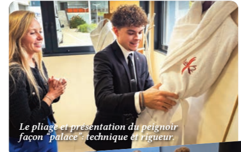
Le pliage et présentation du peignoir façon "palace": technique et rigueur.

*housekeeping: département hôtelier responsable de l'entretien esthétique de l'établissement et de la création d'un environnement plus sûr et accueillant pour les clients.