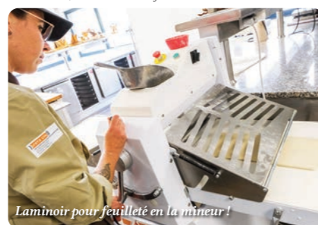
Laminoin pour feuilleté en la mineur!