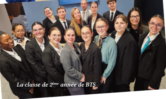
La classe de 2 ème année de BTS