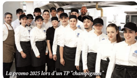
La promo 2025 lors d'un TP "champignon"