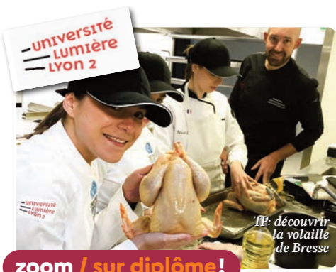
TP: découvrir la volaille de Bresse