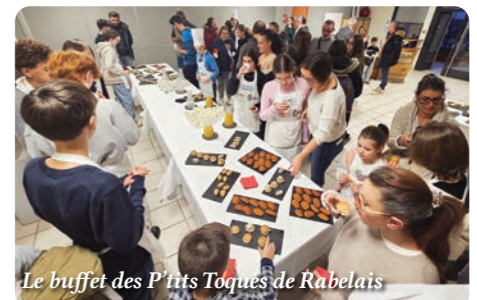
Le buffet des P'tits Toqués de Rabelais